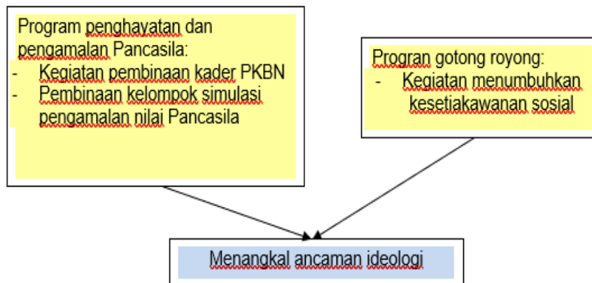
Gambar 2 Pencegahan ancaman ideologi melalui program PKK

terhadap ancaman berdimensi ideologi, sebagaimana diuraikan pada diagram dibawah ini: